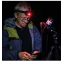
PER RASMUSSEN Fotograf; reportage, portrætter og naturfotografi

Jeg så engang syv stjerneskud, en aften min mor havde puttet os udenfor for at falde i søvn. Jeg lå bare og kikkede op i himlen på alle stjernerne. Og ønskede. Men jeg havde ikke ønsker nok til dem alle sammen.